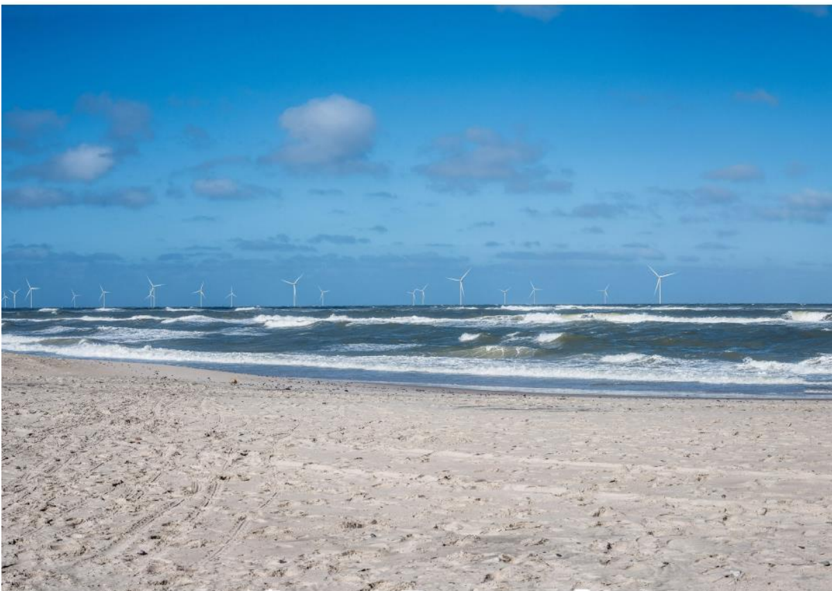
4 VENSTRE SIDE AF PANORAMA (OBS: kun 22 af de i alt 33 møller er synlige indenfor dette dobbelt-brede fotoudsnit)